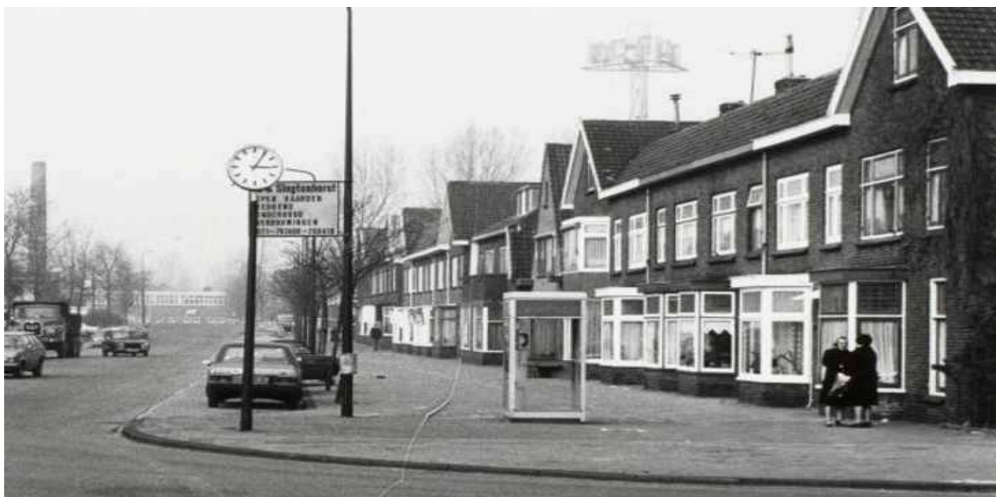
De Zoeterwoudseweg, gezien vanaf de Tomatenstraat eind 1970.