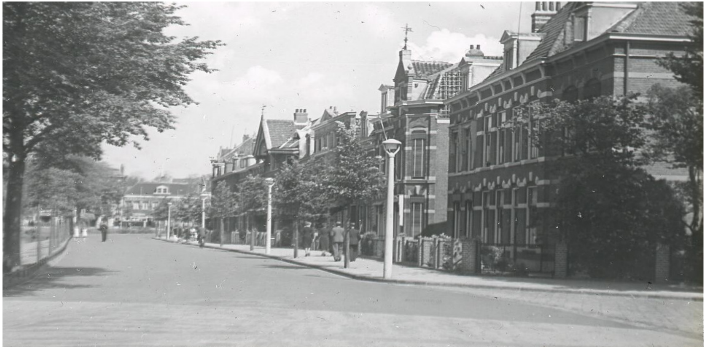
De Zoeterwoudsesingel gezien vanaf de Fruinlaan.